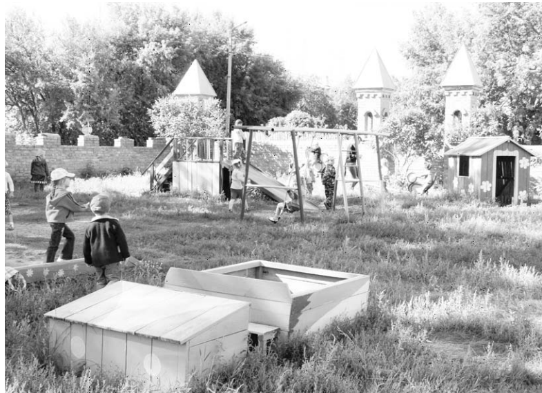
Детский сад «Петушки».