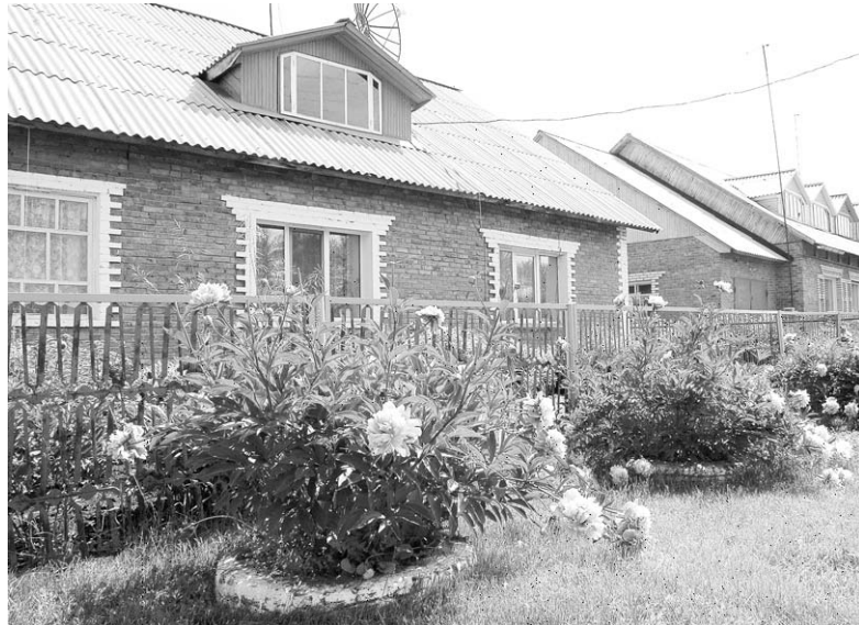
Усадьбы труженников ЗАО «Ирмень».