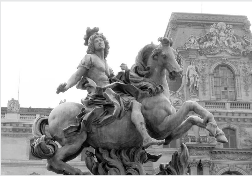
Статуя Людовика XIV у Лувра.

Кстати, не исключено, что именно на строительных работах в Версале родилось современное медицинское страхование. Людовик XIV строго распорядился возмещать рабочим деньгами любое увечье — будь то перелом руки или ноги.