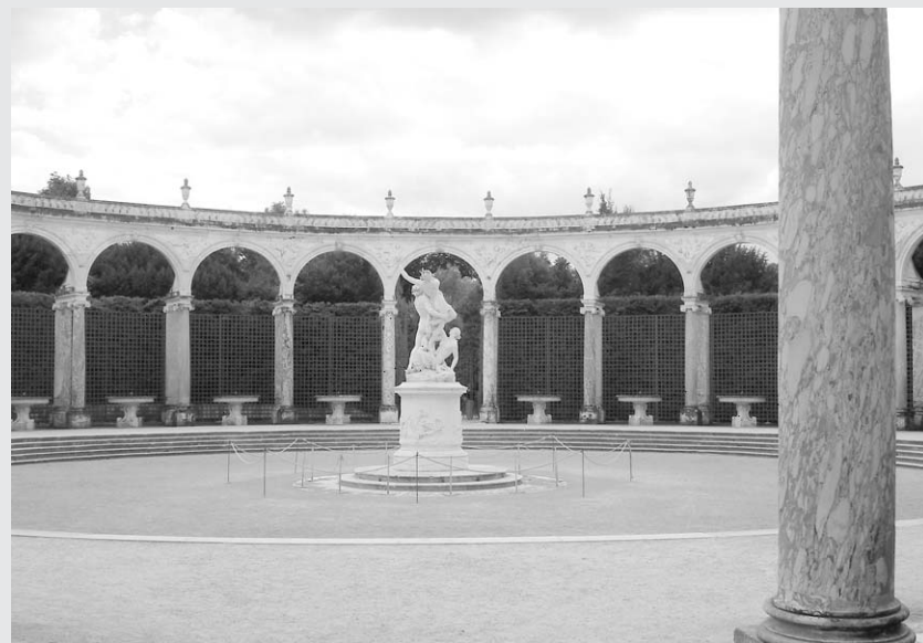
В королевском парке.

Как только король окончательно переехал в Версаль в 1682 году, дворец тут же стал местом настоящего паломничества для всех желающих лицезреть своего монарха. Одни хотели просто видеть, как король обедает, другие желали поправить свои дела, обратившись к нему с просьбой или прошением. Вопреки расхожим мифам, персоне французского короля, а в особенности во времена